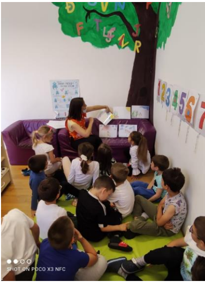
SHOT ON POCO X3 NFC