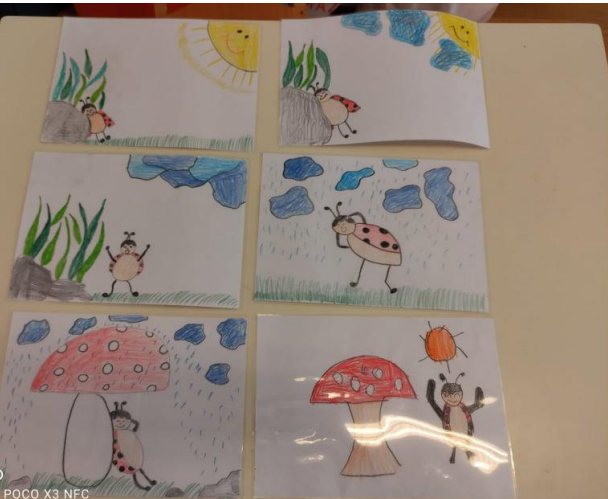
SHOT ON POCO X3 NFC