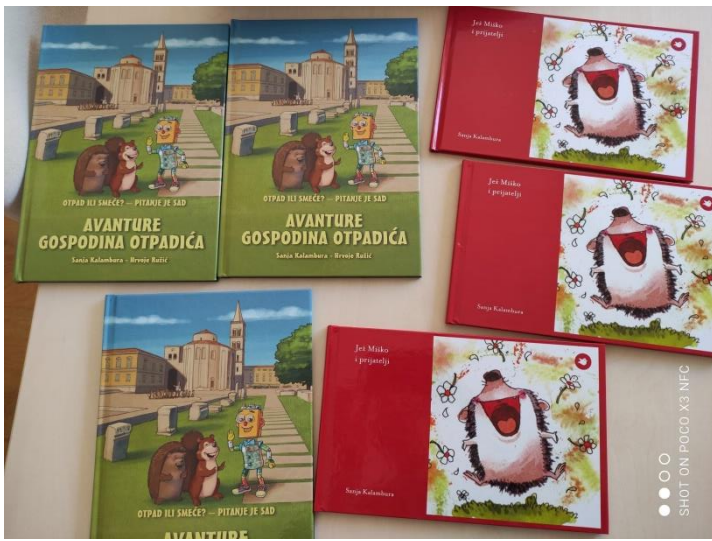
SHOT ON POCO X3 NFC